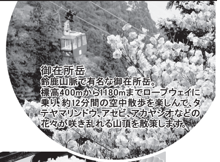
御在所岳 鈴鹿山脈で有名な御在所岳。 標高400mから1180mまでロープウェイに 乗り、約12分間の空中散歩を楽しんで、夕 たやマリンドウ、アセビ、アカヤシオなどの 花々が咲き乱れる山頂を散策します。

天王川公園の藤棚 天王川公園には、5000㎡を超える藤棚があります。 ゴールデンウィークの頃に野田藤、九尺藤、紫藤、曙藤 など様々な種類の藤の花が咲き乱れ、天下一、東洋一 ともいわれています。