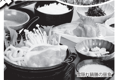
雪隠れ鍋膳の昼食